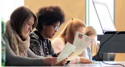
Politische Tage im Landratsamt Esslingen.