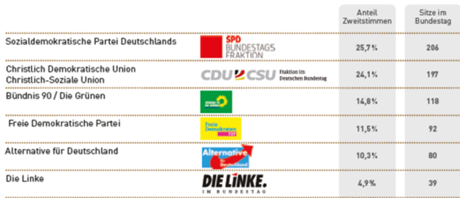
Die Fraktionen im Deutschen Bundestag nach der Bundestagswahl 2021