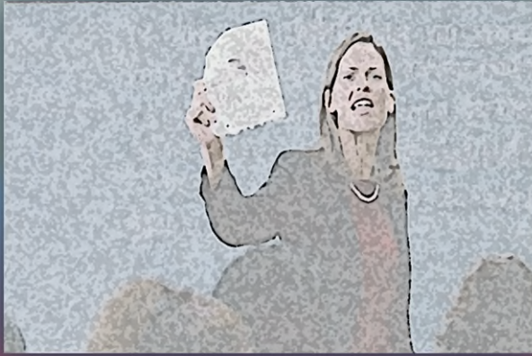
Kontroversität als prekäre Produktivkraft

Die Orientierungskursleiter:innen, die wir im Haus auf der Alb fortbilden, berichten von schwierigen Situationen im Unterricht, die mit der Migrationsbiografie der Teilnehmer:innen oder mit ihrem Status hier zu tun haben. Die Konfliktebenen sind vielfältig. Es gibt Konflikte zwischen Lernenden, die bisweilen, längst nicht immer identitär